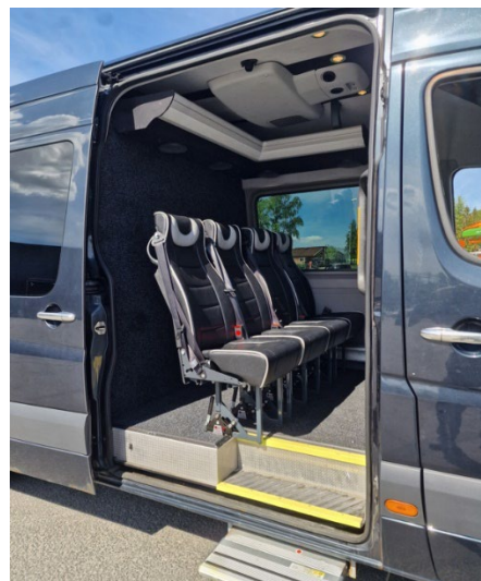
Komplett rigg: Mobil scene 8x4,3 meter, Mercedes 516 med lyd og lys-utstyr og plass til fem personer + sjåfør.