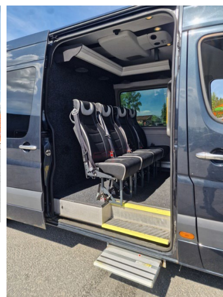
Komplett rigg: Mobil scene 8x4,3 meter, Mercedes 516 med lyd og lys-utstyr og plass til fem personer + sjåførr.